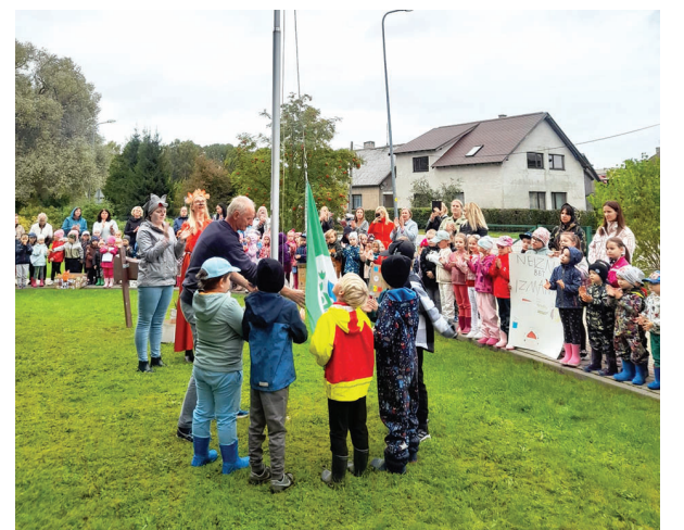
„Zaļais karogs” svinīgi tiek pacelts pie Talsu PII „Pīlādztis”

Pedagogi iegulda laiku, lai pielāgotu mācību programmu Ekoskolas programmai un lai ietvertu Ekoskolas tēmu