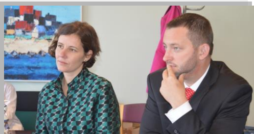
Ekonomikas ministres vizīte Mērsraga novadā

Mērsrags ir ģimenei un atpūtai draudzīgs novads! Mērsrags ir vieta, kur satiecībā un mierā viena ar otru sadzīvo osta un dzeltenām kvarca smiltīm klātā pludmale. Vietā, kur cilvēkiem piemīt jūras vēja audzēts spīts un visi darbi tiek pavadīti ar dziesmu un deju. Ikviens Mērsraga novada iedzīvotājs ciena pagātņi, domā par nākotni, un čakli strādā šodienai, lai apstiprinātu ikvienam zināmo saukli „Mērsrags – iespēju rags!”.