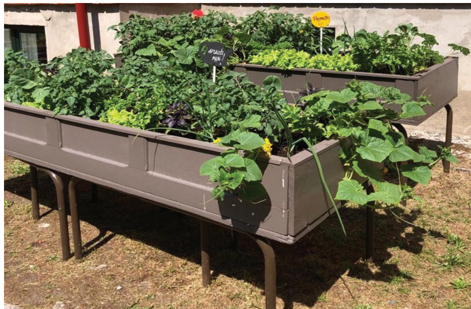
„Gaisa dārza” aug gan mazie tomāti un Briseles kāposti, gan dažādi garšaugi