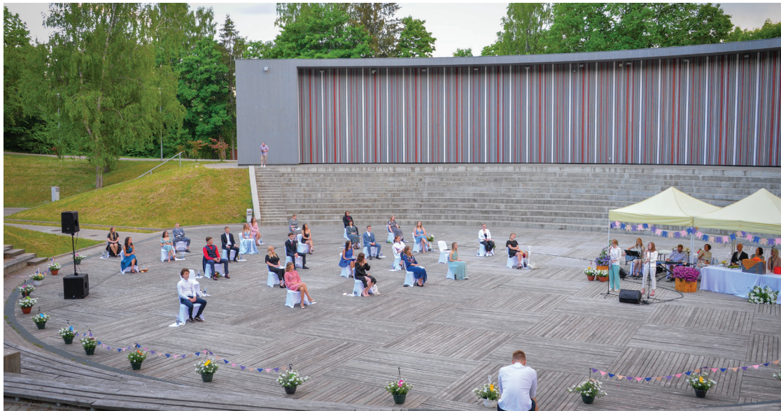
Izlaiduma norise Talsu Valsts ģimnāzijas 12. klases absolventiem Sauleskalnā

Lai nepārkāptu epidemioloģiskās drošības prasības, izlaidumi tika organizēti divu dienu garumā 11. un 12. jūnijā vairākās daļās, katras klases audzēkņus aicinot citā laikā. Lai gan otrā izlaiduma diena nelutināja ar jauku laiku, Talsu 2. vidusskolas admi-