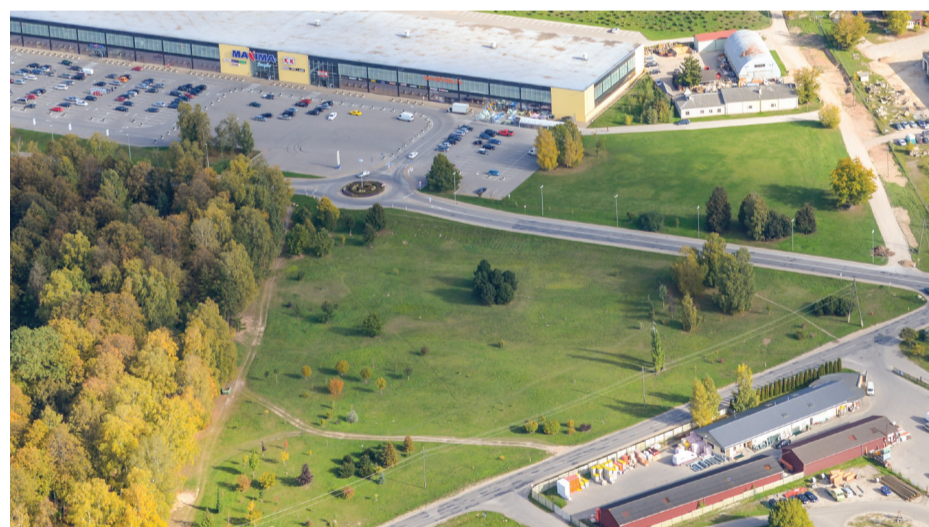
Jaunās ēkas būvniecībai par piemērotāko vietu atzīta teritorija Rīgas un Miera ielas krustojumā ar kopējo platību 1,9039 hektāri