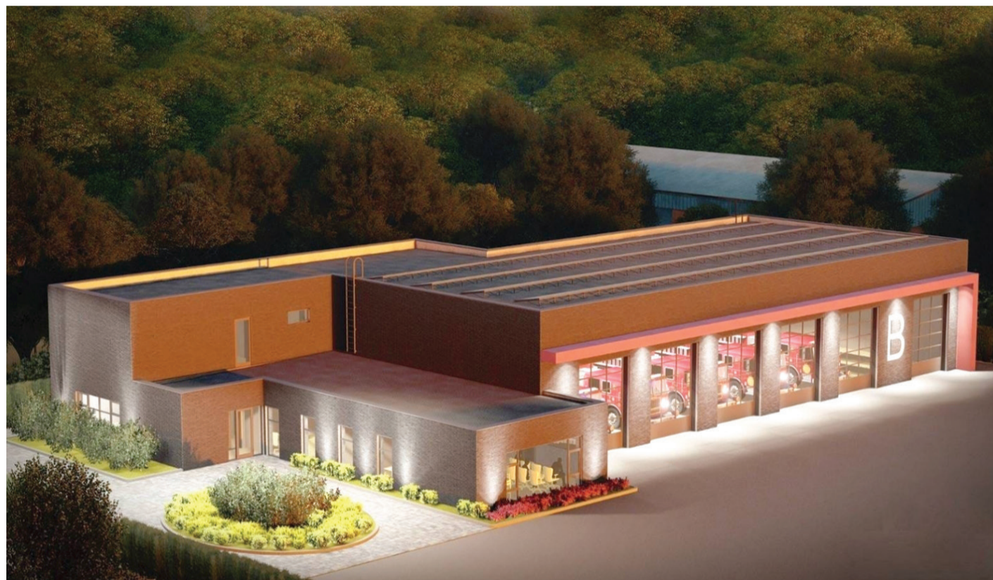
Ilustratīvs attēls B kategorijas depo ēkai

Sākotnēji pašvaldība piedāvājusi tai piederošos zemes īpašumus K. Valdemāra ielā 134, „Dzelzupīte 2” un 9. maija ielā 19, bet tie apbūvei nebija piemēroti teritorijas ierobežotības dēļ. Tā kā jaunā depo ēka plānota 1922 m 2 liela, bet vēl nepieciešama platība stāvvietu ierīkošanai, tad aģentūra lūgusi iespēju piešķirt pašvaldības īpašumā esošu zemes gabalu, kas būtu vismaz 12 000 m 2 platībā. Līdz